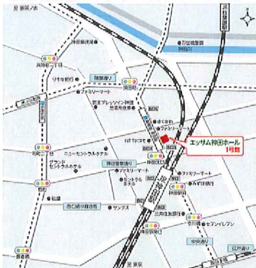
〔東京会場〕エッサム神田ホール1号館

10. 振込み 三菱東京UFJ銀行神保町支店、普通口座（口座名：接着管理士会、口座番号：1984391）にお振込み下さい。